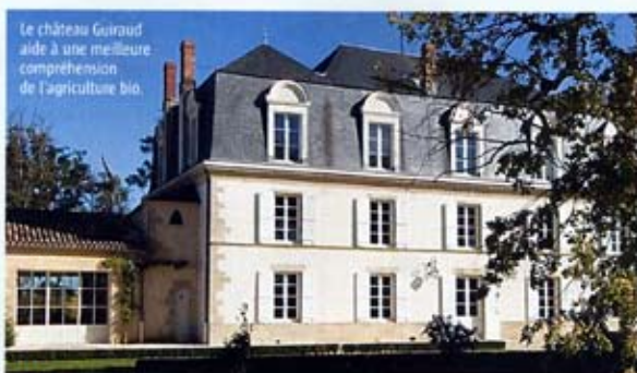
Le château Guiraud aide à une meilleure compréhension de l'agriculture bio.